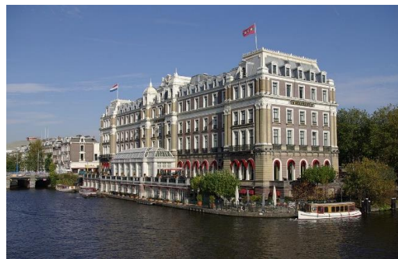
Het Amstelhotel in Amsterdam waar nog steeds een fysiotherapeut werkzaam is om de hotelbezoekers met fysieke klachten te kunnen behandelen met fysiotherapie.

Om al deze patiënten uit heel Europa te behandelen koos Mezger niet het minste gebouw uit in zijn geboortestad. De wonderdokter ontving namelijk zijn patiënten in het prachtige Amstelhotel in Amsterdam.